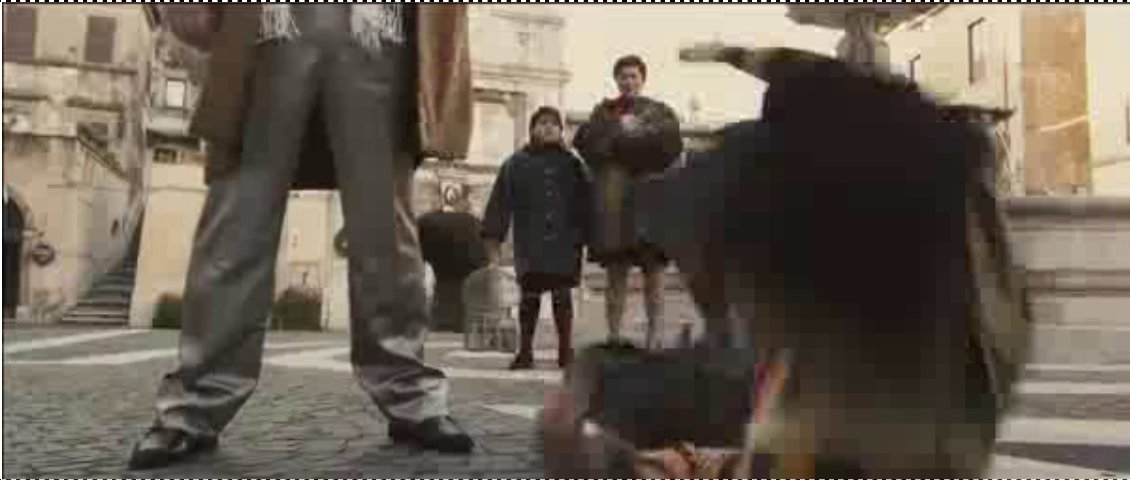
Lo lascia cadere a terra