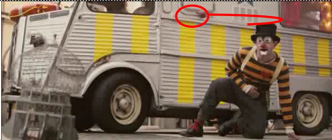
Gli cade in testa