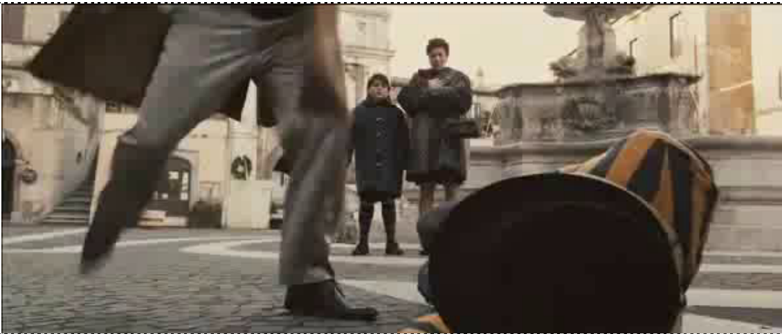
Gli tira un calcio