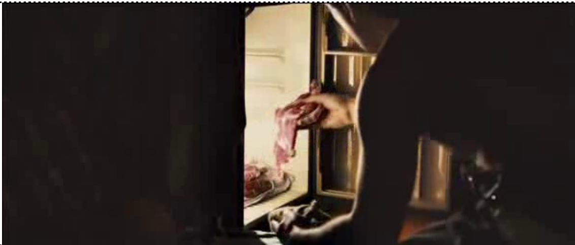
La tira fuori dal frigorifero